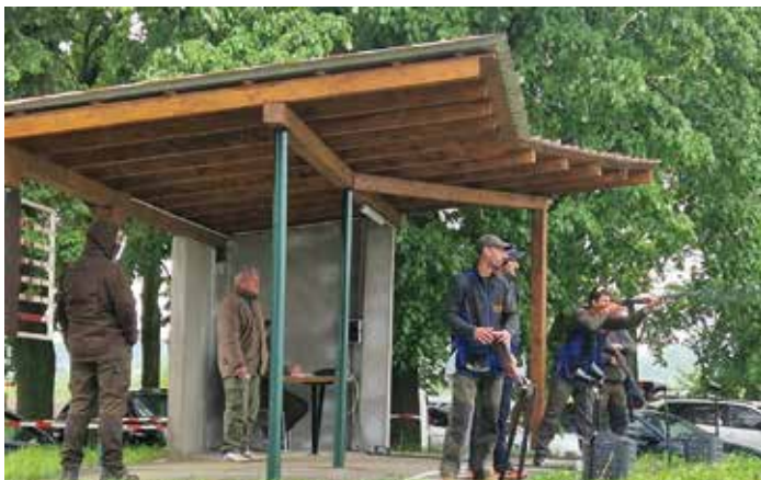
Streljište LD „Graničar – Sokol“ pravi je ponos lovaca

no je nekoliko visokih zasjeda (čeka) i hranilišta za srne i fazane. Pojavom afričke svinjske kuge u Slavoniji lovci se aktivno, koliko to dopuštaju, uključuju u borbu za sprječavanje širenja ove bolesti na području lovišta. Osim izgradnje lovnogospodarskih i lovnotehničkih objekata u lovištu, članovi LD „Graničar - Sokol“ aktivno sudjeluju u svim aktivnostima općine i udruga.