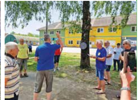
Opušteno i veselo na Umirovljeničkim sportskim igrama