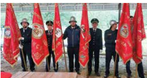
Hodočašće u Dragotin