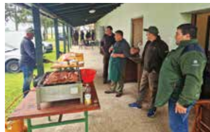
Lovci su uvijek dobri domaćini

„Graničar-Sokol“ bilo domaćin 4. kola Trap lige. Riječ je o popularnoj disciplini streljaštva, u kojoj su mete glineni golubovi. Tijekom natjecanja mete se izbacuju iz stroja pod različitim kutovima, pružajući izazov i uzbuđenje svim sudionicima. Radi toga je natjecanje privuklo mnoge entuzijaste i ljubitelje streljaštva. Nažalost, za velikoga nevremena u kolovozu 2023., olujni vjetar rušio je stabla u dvorištu lovačkoga doma. Na strelištu je nastala šteta koju su lovci uspjeli sanirati, a porušeno drveće poslužiti će uglavnom kao ogrijevno drvo. Osim desetak stabala jasena i bora, vjetar je porušio koš (čardak) za kukuruz, a u samom lovištu poruše-