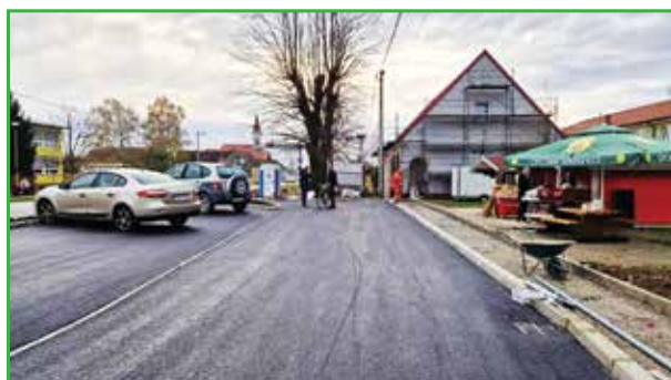
Ispred trgovine izgrađeno je parkiralište koje će olakšati i dostavu i kupovinu

na i da bi im se isplatilo. Naši su ljudi vrijedni, najveći im je problem kako početi. Često se dolaze raspitivati, mi im pokušavamo pomoći, jer i to je naša uloga u ovoj općini.