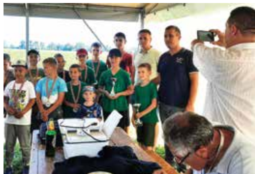
Rad s mladima daje rezultate