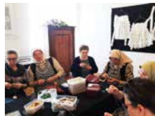
Radionica u Ozlju

Izvan granica Hrvatske, „Sikirevački motivi“ virtualno su sudjelovali na međunarodnoj konferenciji sunčane čipke u Venezueli „Sol Lace Day“, na kojoj su se okupili ljubitelji sunčane čipke iz dvadesetak zemalja. Da to nije bio najveći izazov pokazuje i činjenica da su članovi udruge uspjeli biti na dva mjesta u isto vrijeme. Jedna ekipa zaputila se put Slovenije u Železnike, a druga ekipa u slovač-