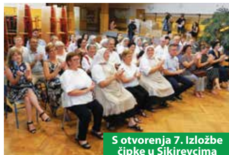
S otvorenja 7. Izložbe čipke u Sikirevcima

Brodu i Gradskom knjižnicom Slavonski Brod priredili izložbu i radionicu izrade sunčane čipke