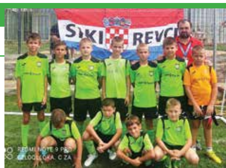
Igrači ŠNOS-a na Turniru u Tribunju

da u lipnju sudjelovali na turniru i odmjerili snage sa svojim vršnjacima. Sudjelovanje na ovom turniru novi je korak u izgradnji čvrstih veza Sikirevaca i Tribunja.