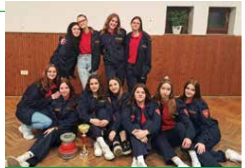
Članice sikirevačkog DVD-a na natjecanju u Piškorevcima

novi DVD-a Sikirevci također aktivno sudjeluju i na zimskim kupovima koje organiziraju druga vatrogasna društva. To je prilika za testiranje i demonstraciju vještina, ali i za razmjenu iskustava, stjecanje novih znanja i jačanje timskog duha. Kroz svako odmjerenje snage i spremnosti, članovi DVD-a Sikirevci potvrđuju svoju stručnost, predanost i želju za kontinuiranim usavršavanjem u službi zajednice.