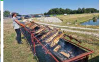
Prizor za poželjeti