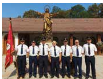
Hodočašće u Šumanovce