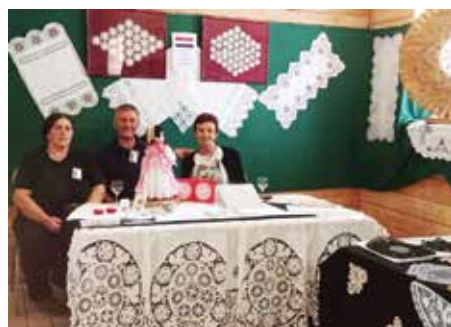
S promocije u Slovačkoj

Lokalno, u srpnju su članovi udruge svoje radove izložili u Cerni i Štitaru. Nastavak promocije motiva na lokalnom području članovi su odradili u Lapovcima na domaćoj manifestaciji.