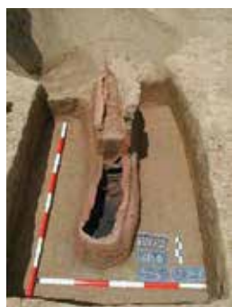
Brončana igla iz kasnog brončanog doba s lokaliteta Jaruge - Gođevo 2

Muzej Brodskog Posavlja, Arheološki odjel