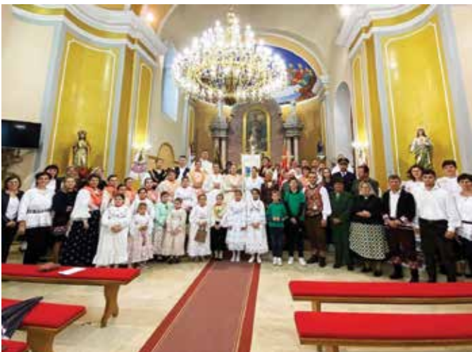
Misa zahvalnica u župnoj crkvi Sikirevci