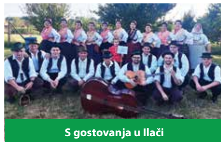
S gostovanja u Ilači

udrugom Sikirevci bili su organizatori zabavne Olimpijade starih sportova. Manifestaciju su zaključili „Sikirevačkom kudi-jadom“ na kojoj su im gosti bili ŽPS „Skladovke“ iz Đakova, KUD „Kupina“, KUD „Vesela Šokadija“ iz Gundinaca, KUD „Ivan Filipović“ iz Velike Kapanice, KUD „Berislavić“ iz Novog Grada te „Sinđir“ - Prva pjevačka konjica. Nakon nastupa, večer se nastavila uz zabavu do kasno u noć uz TS Caprio.