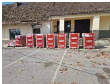
Intervencijom općine nabavljen je dio crijepa za sanaciju krovova