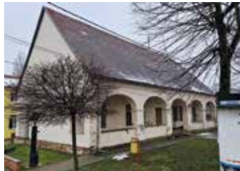
Prije početka radova

Dugoočekivanim projektom rekonstrukcije i opremanja Etno kuće u Sikirevcima želi se stvoriti prostor koji će obuhvatiti kušaonicu domaćih proizvoda u prizemlju te izložbeni prostor za udruge u potkrovlju. Financijska podrška za ostvarenje ovog plana dolazi od Ministarstva regionalnoga razvoja i fondova Europske unije (MRRFEU), koje sufinancira projekt s 2.400.000 kuna odnosno 31.850 eura. Etno kuća osmišljena je tako da promovira lokalne proizvode i pruža prostor za aktivnosti i priredbe lokalnih udruga, istovremeno čuvajući i prezentirajući kulturnu baštinu i tradiciju regije. Radovi su započeti početkom godine i lijepo napreduju.