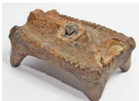
Brončana fibula (kopča) iz mlađeg željeznog doba s lokaliteta Jaruge - Krnjice 1