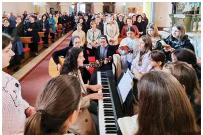
Četiri sestre bile su animatorice duhovnih događanja

radionice za djecu i mlade te prisutnost na euharistijskim slavljinama na svim nedjeljnim misama bile su samo neke od aktivnosti tijekom ovoga susreta koji je obogatio župsku zajednicu, pogotovo mlade.