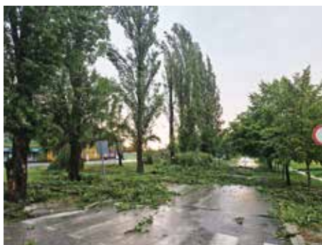
Najvidljivije su štete na drveću