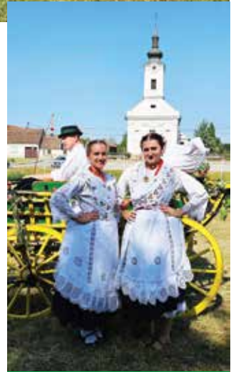
„Čija kola“ ispunjena su ponosom i tradicijom

Krajem kolovoza, Sikirevci su bili domaćin još jedne posebne konjogojske manifestacije – „Čija kola“. Ovo natjecanje i prezentacija imaju cilj očuvanje tradicije uzgoja konja. Kroz kombinaciju natjecateljskog duha i reprezentativnih priredbi, „Čija kola“ naglašavaju važnost tradicije i posvećenost očuvanju konjogojstva u Sikirevcima. Sve u svemu, Konjogojska udruga Sikirevci kontinuirano radi na promociji i očuvanju konjičke tradicije kroz razne manifestacije i aktivnosti, dokazujući da je ljubav prema konjima i njihovom uzgoju u općini Sikirevci živa i jaka.