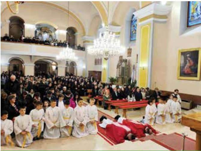
Obred Velikog Petka