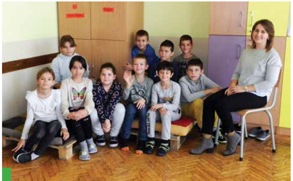
Učenici su zadovoljni cjelodnevnom školom

- Ministar Fuchs je lijepo rekao da imamo povijesnu priliku konačno dignuti obrazovni sustav na razinu koju zaslužuje. Nije li ovaj eksperimentalni program bio prilika za sve škole koje ispunjavaju uvjete, koje rade u jednoj smjeni, da se uključimo u pravu javnu raspravu koja će teći tijekom četiri godine, kroz koje imamo priliku podržati ono što je dobro zamišljeno i sve poteškoće na koje naiđemo riješiti i popraviti, dati svoje mišljenje, kritike, pohvale. Počeli smo školsku godinu pomalo kaotično, ali izazovno i drukčije. Sve se to polako rješava kada imamo jasan cilj pred sobom. Vizija škole je omogućiti učenicima pravilan socijalni i intelektual-