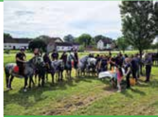
Drugi Stanarski susreti u organizaciji KU Sikirevci