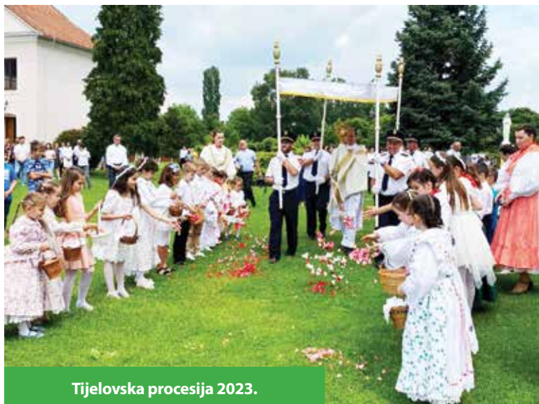
Tijelovska procesija 2023.

- Bilo je manje štete na zgradi našega muzeja, ali naši vjernici su priskočili i to sanirali. Nešto veća šteta bila je u Jarugama, tu smo kupili novi crijep, a župni suradnici su opet priskočili i strojevima i radom. Sve smo sanirali, iako je naša šteta na crkvenoj imovini minimalna. Ljudi su imali puno većih šteta, ali i ovdje se očitovalo zajedništvo, sloga, a to je jako važno i dobro.