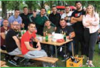
Raspoloženi sudionici i organizatori