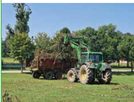
Svi raspoloživi strojevi i ljudi uključili su se u akciju