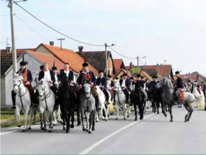
Trideset godina Sikirevci su domaćin pokladnoga jahanja