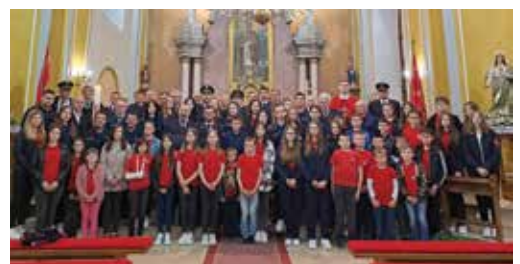
Proslava sv. Florijana