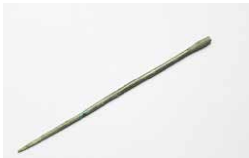
Brončana igla iz kasnog brončanog doba s lokaliteta Jaruge - Gođevo 2

Na prostoru Jaruga su iz razdoblja brončanog doba (oko 2500. - 750. godina prije Krista) poznati arheološki nalazi s lokaliteta Jaruge - Gođevo, Jaruge - Gođevo 2 i Jaruge - Krnjice 1.