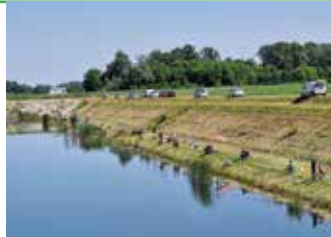
Natjecanje u Jarugama ŠRD Smuč je odlično organizirao