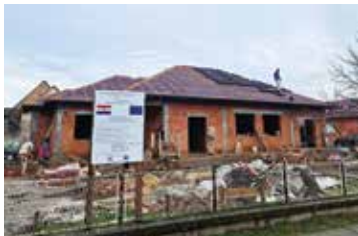
Vrtić je krov dobio u siječnju, a na naslovnici se vidi koliko su radovi napredovali

Izgradnja dječjeg vrtića nastavila se kroz ovu godinu. Projekt s 85% financira Europska unija, dok ostatak dolazi iz sredstava Republike Hrvatske. Početkom godine, odmah u siječnju, zgrada je stavljena pod krov, a radovi su znatno napredovali tijekom ljetnih mjeseci.