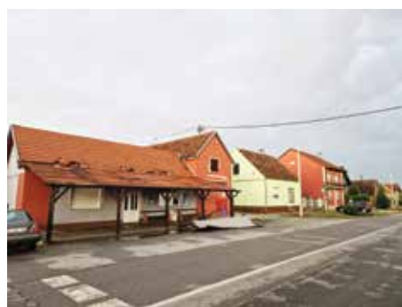
Kod manjih oštećenja hitno se popravljalo da šteta ne bude veća