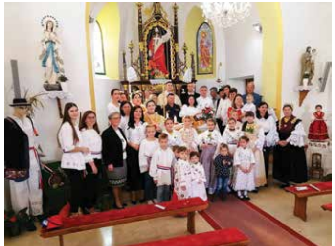
Misa zahvalnica u filijali Jaruge