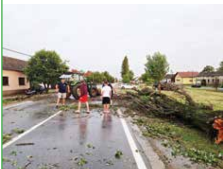
Čim su vjetar i kiša minuli počelo je raščišćavanje prometnica

đevinskim radovima, prije svega pokrivanju oštećenih krovova, čistili ceste i tako pomogli da se posljedice razornog nevremena saniraju što brže kako bi se spriječile još veće štete. Onima koji su duže bili bez električne energije susjedi su posudili agregate. Dodatno, kod zgrade zadruge, osigurana je određena količina vinkovačkog crijepa i kubura, dok je pitka voda bila dostupna kod javnog zdenca preko puta OŠ Sikirevci. Općina Sikirevci poslala je zahtjev Županiji za proglašenje elementarne nepogode i zahvalila svima koji su pridonijeli sanaciji šteta.