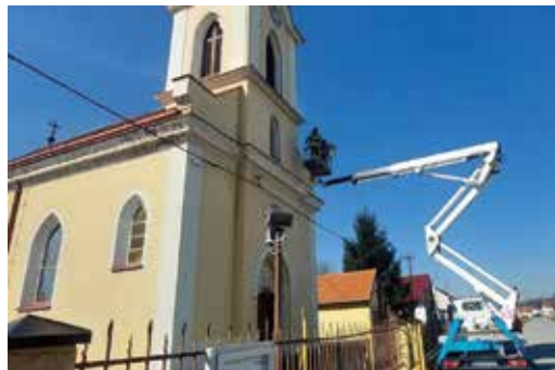
Čišćenje crkve u Jarugama