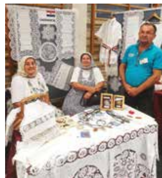
Na festivalu u Poljskoj

ki grad Prešov. Kolovoz je motive odnio u Bugarsku, točnije u grad Kalofer. Početkom rujna na poziv prijateljske Poljske, motivi su bili dio izložbe u Bobowiu.