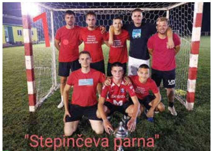
Pobjednici Turnira 2023.

je i pružio priliku za okupljanje dijaspore, povezujući sve generacije. Nakon napetih sportskih natjecanja i prijateljskih susreta, slavlje je trajalo do kasnih noćnih sati.