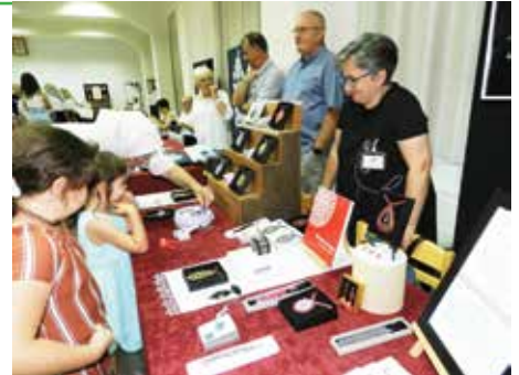
Susret prijatelja povezanih čipkom

Olimpijadu starih sportova ispunjenu smijehom te „Kudijadu“ na kojoj je ove godine gostovalo šest KUD-ova. Konjogojska udruga „Sikirevci“ istog je vikenda okupila ljubitelje konja na manifestaciju „Čija kola“ koja ima izložbeni i natjecateljski duh.