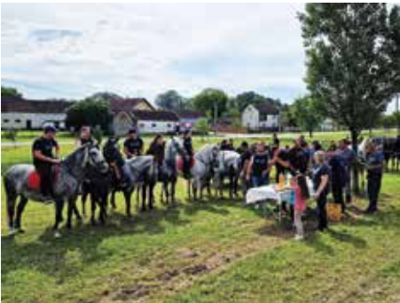
Konjogojska udruga Sikirevci priredila je i druge Stanarske susrete