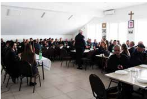
95. godišnja skupština DVD Sikirevci

vu. Ovaj izlet pružio je priliku za druženje, razgovor i prisjećanje na prošla vremena i izazove s kojima su se suočavali. Njihova predanost, znanje i iskustvo postavili su čvrste temelje za današnje vatrogasno društvo koje je prepoznato i cijenjeno na razini sela, općine, pa čak i županije. Društvo im izražava duboku zahvalnost za njihov neprocjenjivi doprinos i trajnu posvećenost zajednici.