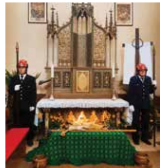
Čuvanje Božjeg groba