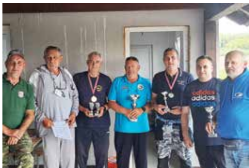
Dobri se ribiči prepoznaju