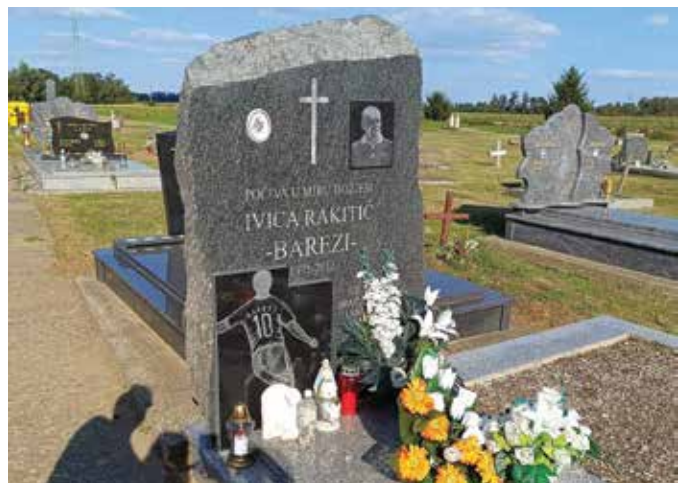
Sjećanje na Ivicu Rakitića već dvadeset godina živi kroz Memorijal Barezi