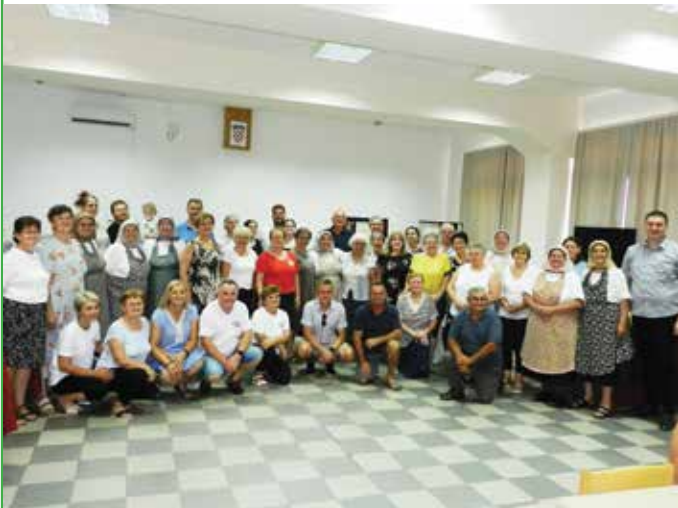
Sudionici sedme Izložbe čipke