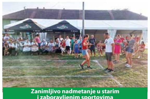
Zanimljivo nadmetanje u starim i zaboravljenim sportovima

niranja rada, projektnog razmišljanja, financiranja i akumuliranja sredstava. Predstavnici KUD-a „Sloga“ usvojili su nova znanja koja im je nesebično podijelila Heritage Chaser - Platforma za primijenjenu etnologiju.