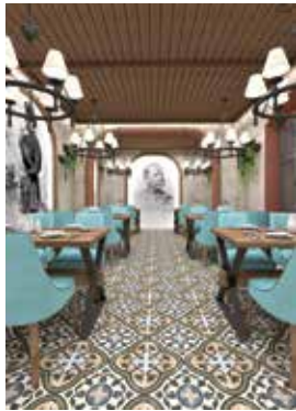
Idejno rješenje za Kušaonicu