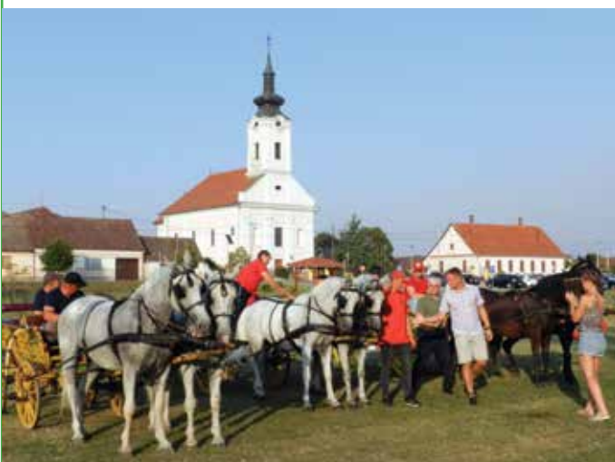
„Čija kola“, manifestacija koja spaja ljepotu, ustrajnost i vještinu, tradiciju i mladost