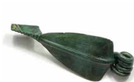
Brončana fibula (kopča) iz mlađeg željeznog doba s lokaliteta Jaruge - Krnjice 1

Željezno doba (750. godina prije Krista - 1. stoljeće) obilježeno je daljnjim tehnološkim napretkom i proizvodnjom željeza. S područja Jaruga zasad su nam poznati arheološki nalazi i dijelovi naselja iz mlađeg željeznog doba (4. stoljeće prije Krista - 1. stoljeće) otkriveni na lokalitetima Jaruge - Gođevo i Jaruge - Krnjice 1. Bila su to veća naselja u kojima je tijekom istraživanja pronađen veći broj dijelova keramičkih posuda te svakodnevne potrošne robe nužne za čuvanje i pripremu hrane. Mlađe željezno doba obilježeno je dolaskom Kelta (Gala) koji su u naše krajeve donijeli niz novih tekovina dotad nepoznatih domaćem stanovništvu: upotrebu brzorotirajućeg lončarskog kola, što je omogućilo serijsku proizvodnju keramičkih posuda, prvu upotrebu novca, predmete od stakla (ponajviše korištenog