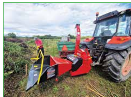
Sjeckalica za usitnjavanje biootpada kupljena je iz sredstava Fonda za zaštitu okoliša i energetske učinkovitosti (80 posto) i općine Sikirevci (20 posto)