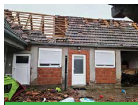
Obitelji su ostale bez krova nad glavom, a nisu mala stradanja ni na poljoprivrednim objektima