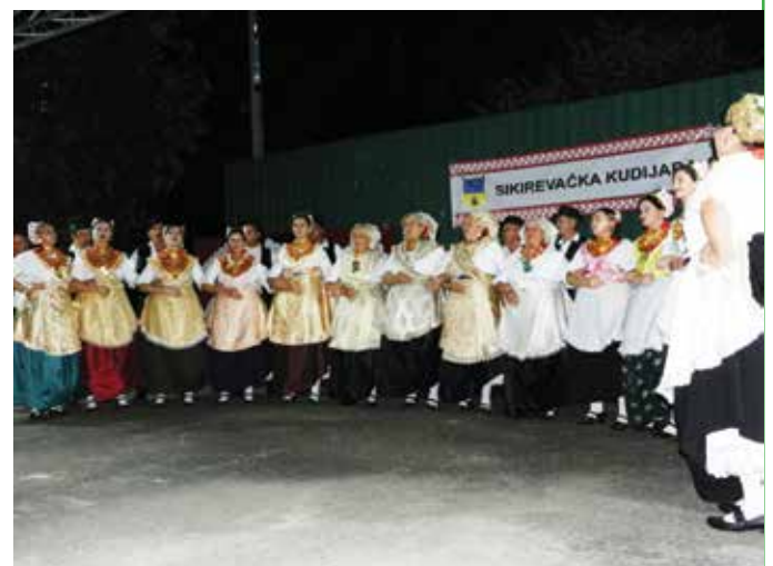
„Kudijada“ je uvijek prilika za užitek koji donose gosti