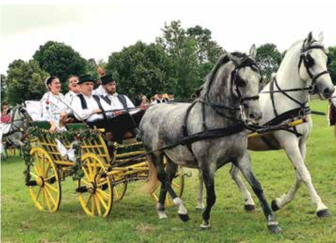
Gosti u Babinoj Gredi