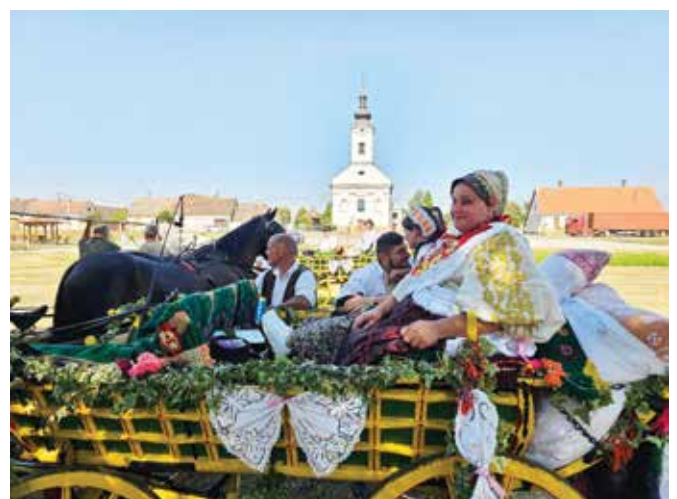
Manifestaciju „Čija kola“ KU Sikirevci organizirao je u sklopu Dana općine Sikirevci