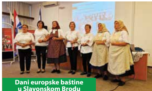
Dani europske baštine u Slavanskom Brodu

ne u program Ministarstva kulture i medija, Dani europske baštine 2023.