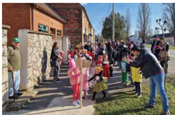
Pokladna povorka obradovala je i sudionike i promatrače