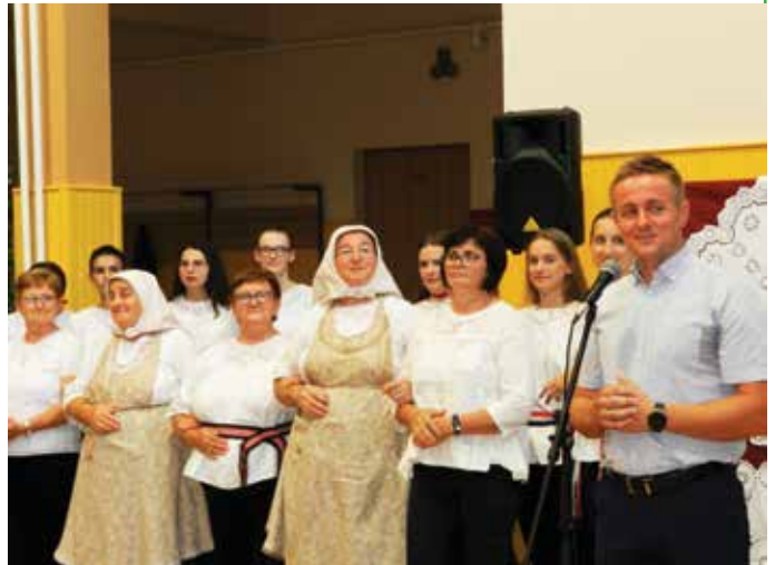
Izložba čipke počela je prigodnom svečanošću